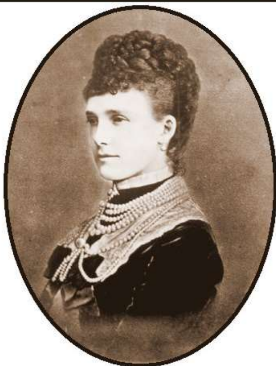
Принцесса Евгения Максимилиановна Ольденбургская (Лейхтенбергская) 1845 - 1925