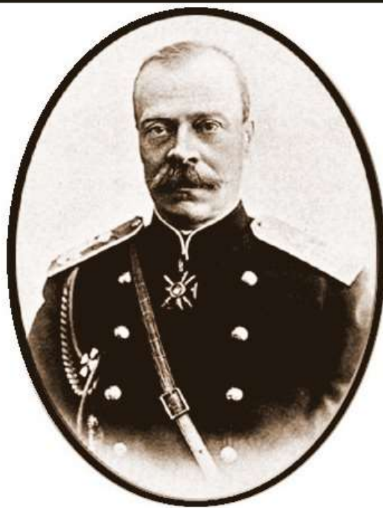
Принц Александр Петрович Ольденбургский 1844 - 1932