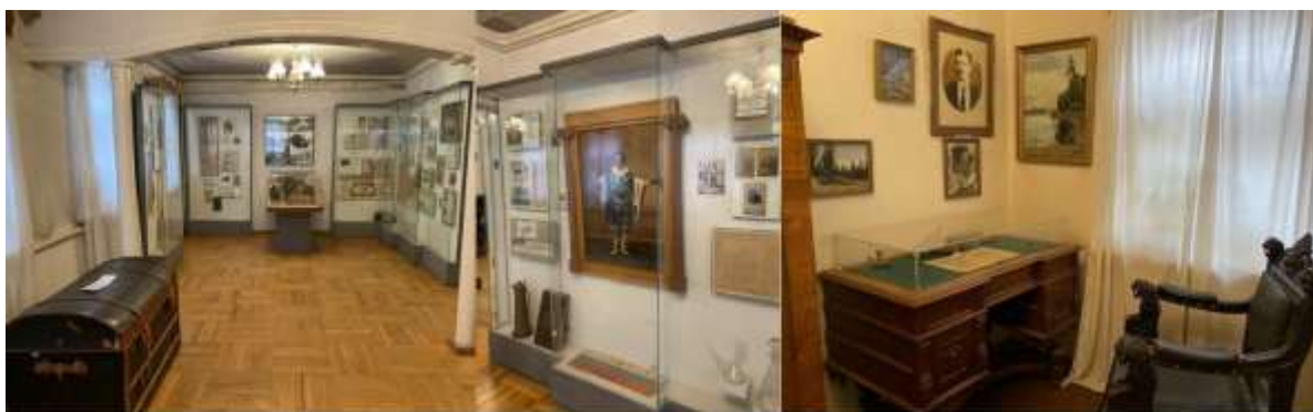
Воронеж, ул. Дурова, 2