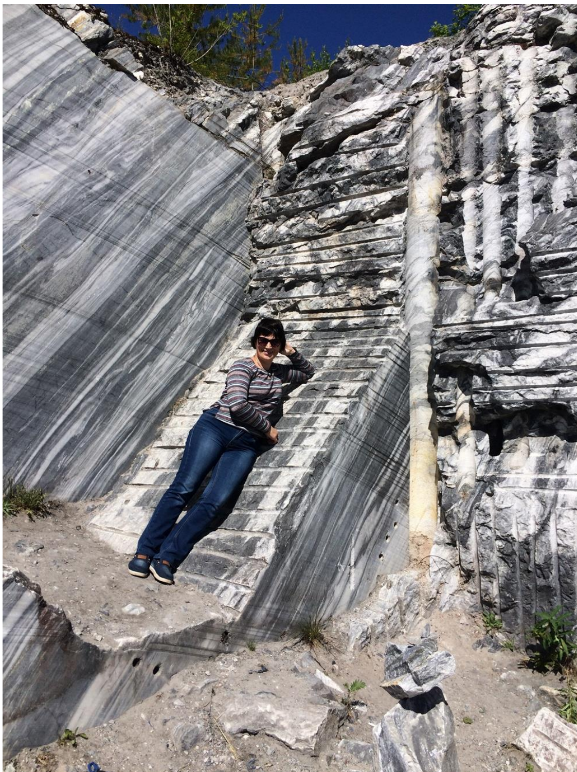
Парк Рускеала, а также территория вулкана Гирвас не раз становились местом кинематографических съемок.