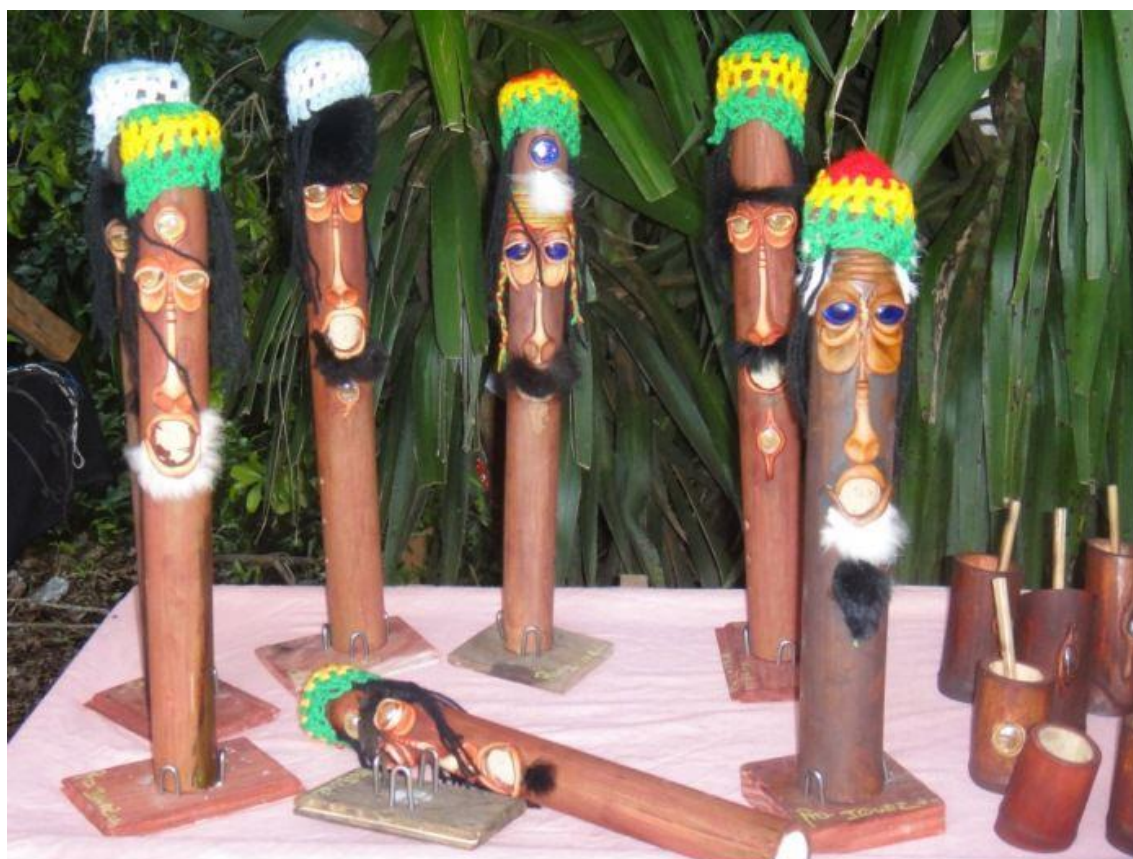
Идеи + фантазия (Idei-plus.ru)

Эти деревянные фигурки, используют в качестве подставок для благовоний. Из рта идет дым.