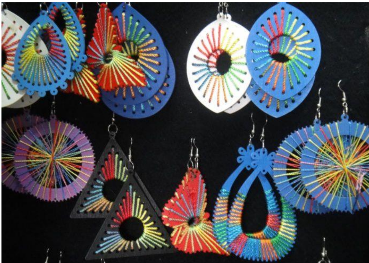
Идея + фактазия (Idei-plus.ru)

Серьги и бусы, комбинированные из дерева, фурнитуры и ниток или вязаных элементов.