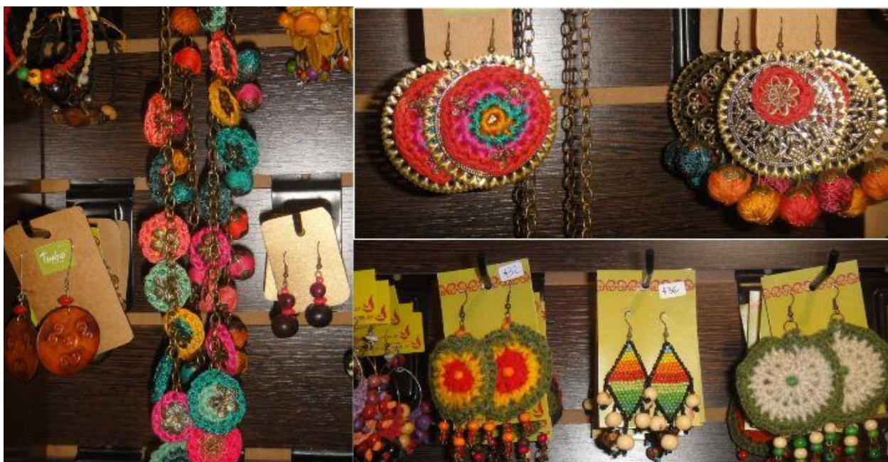
Идея + фактазия (Idei-plus.ru)