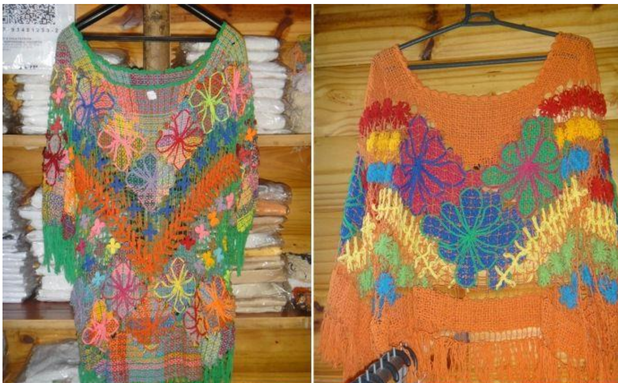
Идеи + фантазия (Idei-plus.ru)

Вязано-плетено-вышитые туники. Технику определить сложно.