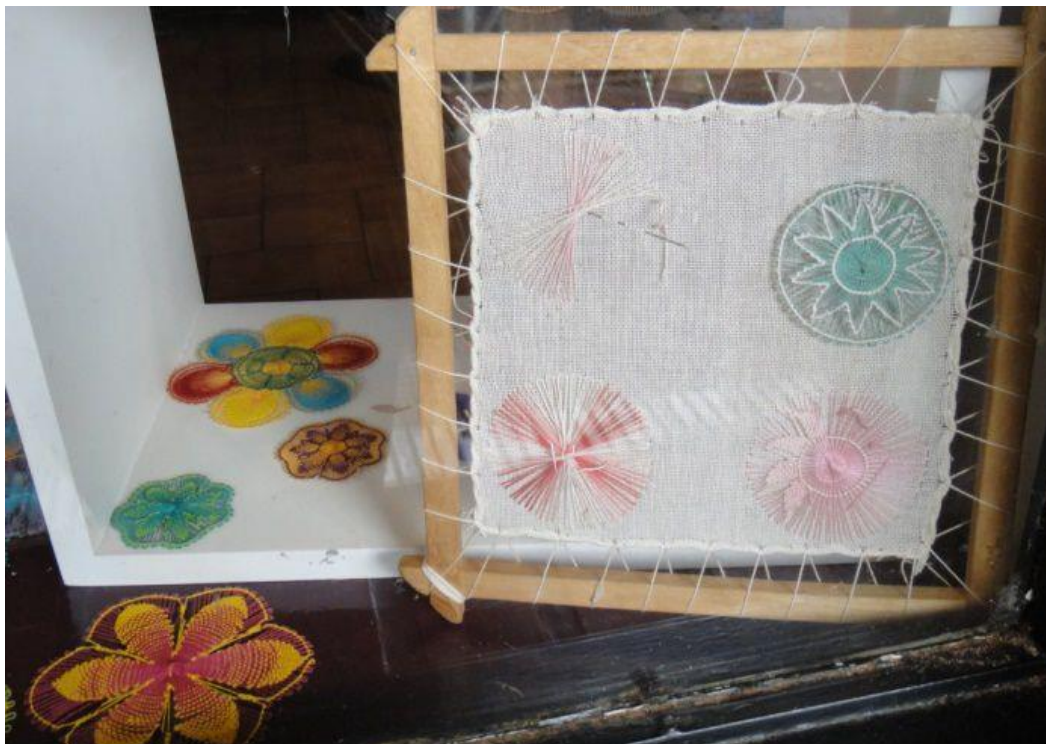
Идеи + фантазия (Idei-plus.ru)

Набрели на магазинчик, в котором увидела изделия в новой для себя технике вышивки или плетения, не знаю, как правильно. Сначала на канве делается контур, затем он заполняется нитками и канва убирается. Очень красивые декоративные элементы получаются.