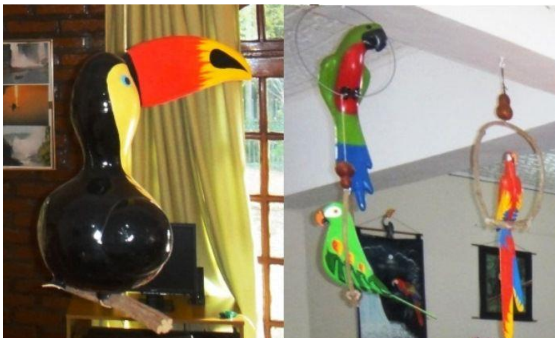
Идеи + фантазия (Idei-plus.ru)

В сувенирных магазинах очаровали попугаи и туканы из дерева. Возможно потому, что они очень понравились вживую, в Парке Птиц. Не удержалась, купила себе похожего))