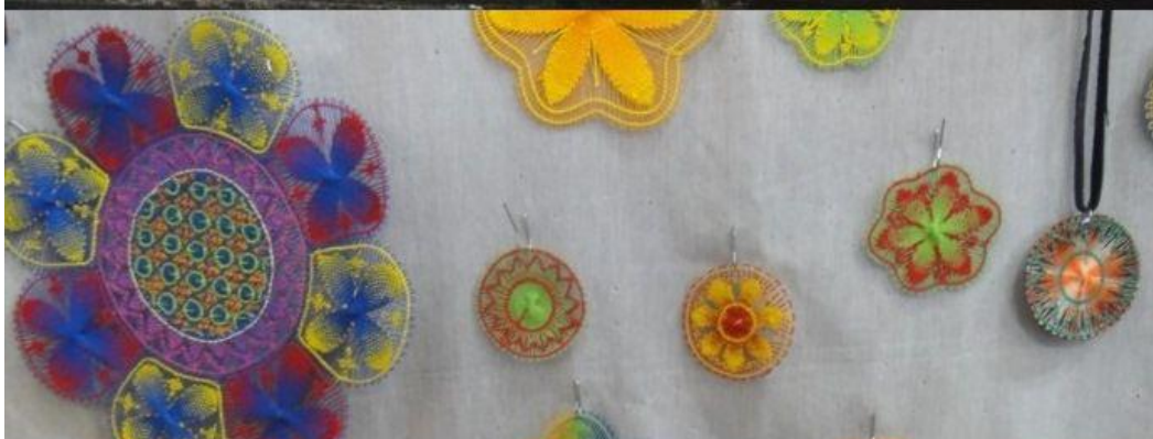
Идеи + фантазия (Idei-plus.ru)