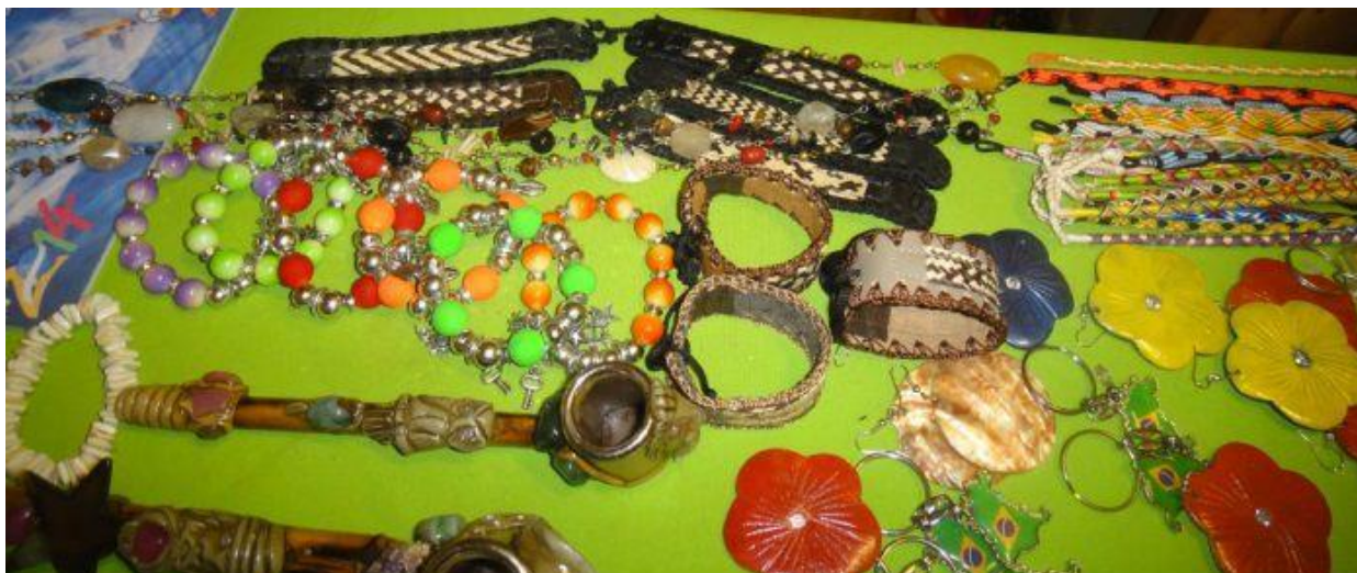
Идеи + фантазия (Idei-plus.ru)

Все сувениры яркие, красивые, позитивные.